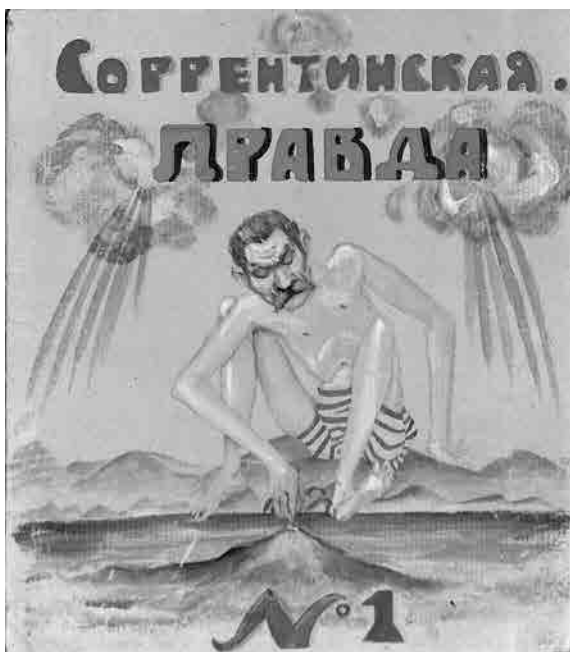
Обложка первого номера домашнего журнала “Соррентинская правда”. Сорренто. 1924