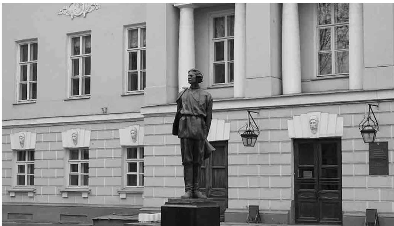
Памятник А.М. Горькому скульптора В. Мухиной (1956) перед Институтом мировой литературы им. А.М. Горького РАН

Миссия Института мировой литературы, этой “Сорбонны литературоведения”, была определена стремлением Горького создать научно-исследовательский центр изучения истории русской и зарубежной литератур, фольклора и центр фундаментальных и прикладных исследований по методологии и теории мирового историко-литературного процесса. В 1949 г. в нём был сформирован Сектор литератур народов СССР. В 1955 г. сектор во-