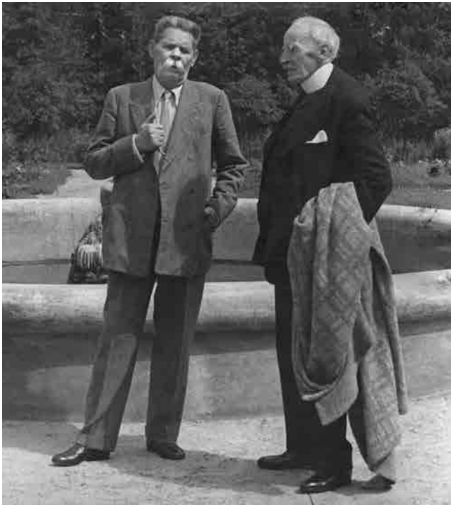
А.М. Горький и Р. Роллан у бассейна. Горки. 9 июля 1935 г.

По приглашению М. Горького в июне-июле 1935 г. Москву посетил Р. Роллан. Первые дни после приезда он провёл в гостинице “Савой”, ожидая встречи со Сталиным в Кремле. Однако уже на другой день после встречи с вождём Роллан переехал в дом Горького. Московское путешествие Роллан описал в своём “Московском дневнике”, переданном позже в Архив А.М. Горького его вдовой. Дневник содержит горькие размышления о трагизме судьбы великого русского писателя: “Горький бросился, забыв обо всём, в русскую революцию <...> его заворожала новая Россия, казавшаяся ещё блистательнее с далёких берегов муссолиниевского Средиземноморья. <...> Тщетно пытается он видеть в деле, в котором участвует, только величие, красоту, <...> он видит ошибки и страдания, а порой даже бесчеловечность этого дела. <...> Несчастный старый медведь, увитый лаврами и осыпанный почестями, равнодушный в глубине души ко всем этим благам, <...> он пытается заглушить свой застарелый пессимизм опьяняющим энтузиазмом и верой окружающих масс” [23, с. 182]. Правозащитная деятельность Р. Роллана в 1930-х годах, постоянно обращавшегося за помощью к Горькому, остаётся малоисследованной страницей политической истории XX в. и заслуживает серьёзного анализа. Требуют внимания и тщательного изучения литературные и общественные связи Горького с западными интеллектуалами, в частности, с французскими писателями Р. Ролланом, Л. Арагоном,