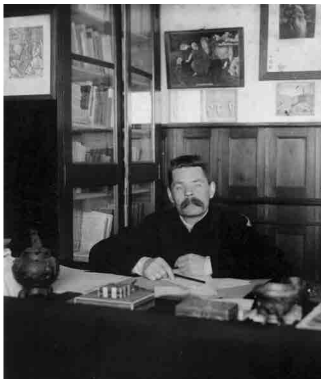
А.М. Горький за письменным столом. Капри. 1907–1908

После Февральской революции разумное и критическое отношение к жизни вело Горького к созданию научно-просветительской Свободной ассоциации для развития и распространения положительных наук во главе с академиком В.А. Стекловым. Идею Горького поддержали академики И.П. Бородин, В.И. Вернадский, А.А. Марков, И.П. Павлов, А.С. Фаминцын и другие. Целью ассоциации ста-