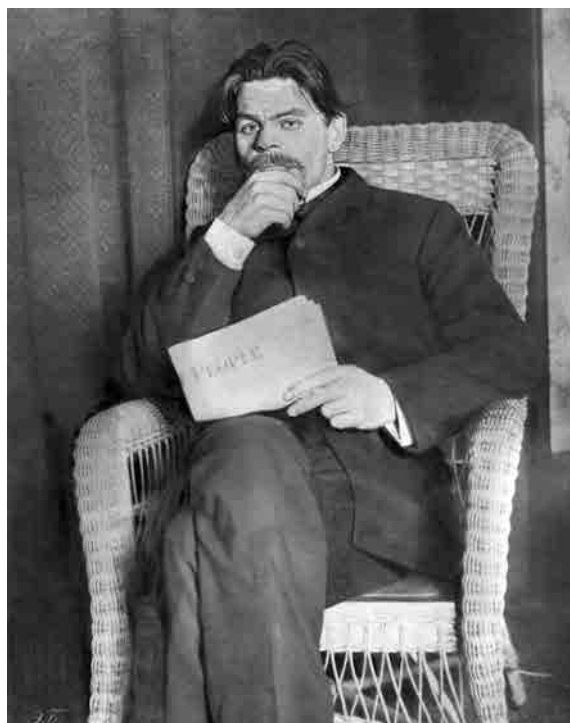
А.М. Горький в поездке по Америке. 1906

Хранящийся в Архиве А.М. Горького “Альбом-адрес” с приветствиями более 50 европейских литераторов и деятелей искусств (Ш. Андерсон, Я. Вассерман, А. Деблин, Ж. Дюамель, Л. Фейхтвангер, Дж. Голсуорси, К. Гамсун, Ю. Енсен, С. Лагерлеф, Г. Манн, Т. Манн, Э. Пискатор, Р. Роллан, Б. Шоу, Г. Уэллс, А. Цвейг, С. Цвейг, Э. Синклер и другие) – яркое свидетельство международного значения Горького. Факсимиле страниц этого адреса