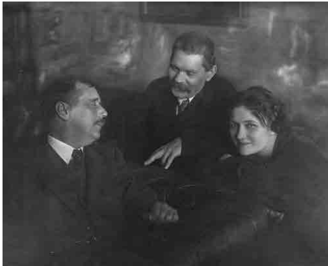
А.М. Горький, Г. Уэллс и М.И. Бенкендорф (Закревская). Петроград. 1920